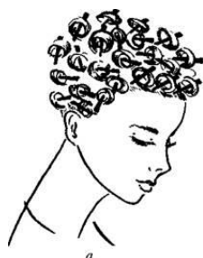
Схема накрутки волосся кільцями