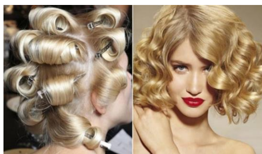
Загалний вигляд зачіски.