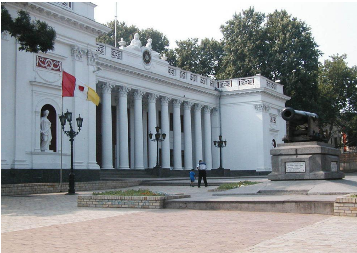
Городская мэрия City Hall