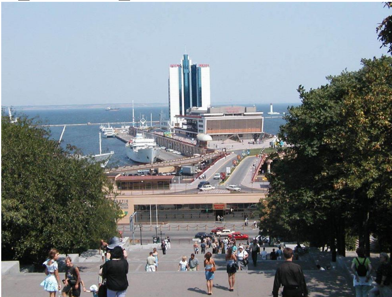
Морской вокзал Maritime Passenger Terminal