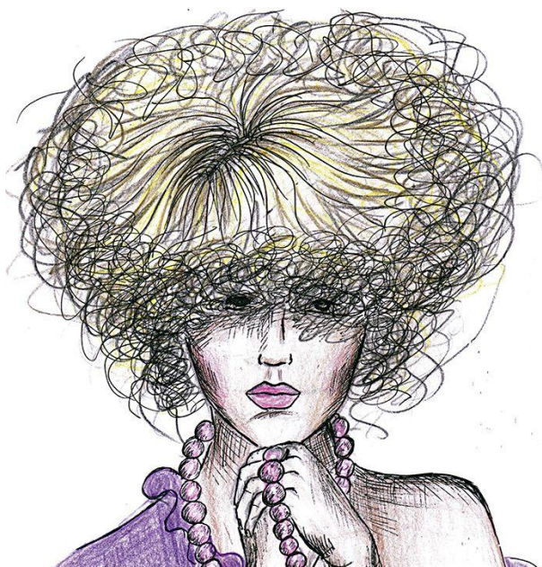
1. Зачіска з акцентом на форму