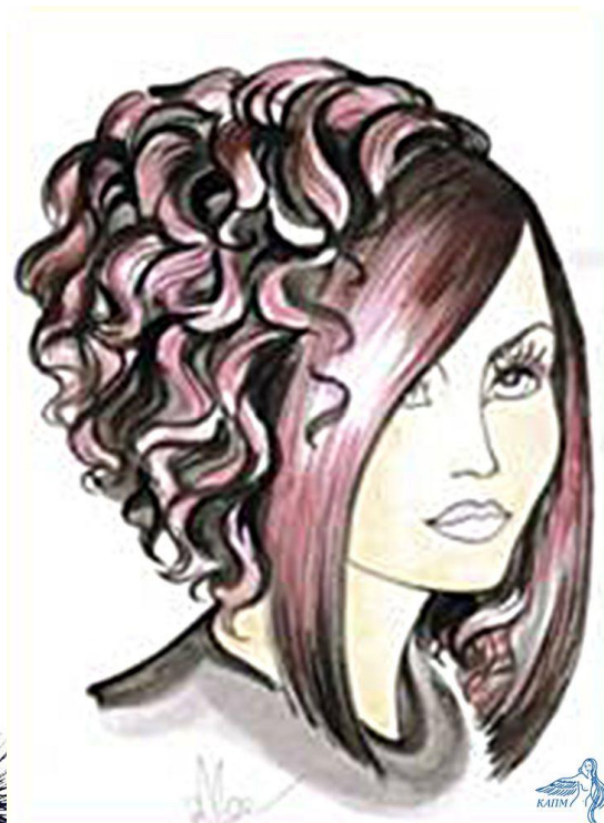
2. Зачіска з акцентом на хвилю