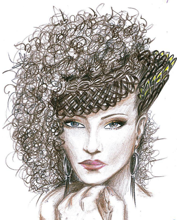
4. Зачіска з акцентом на фактуру