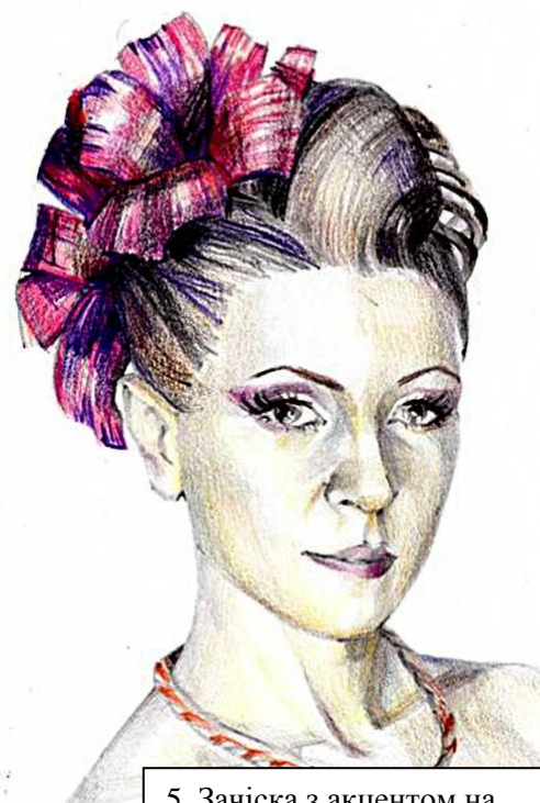
5. Зачіска з акцентом на декоративну прикрасу