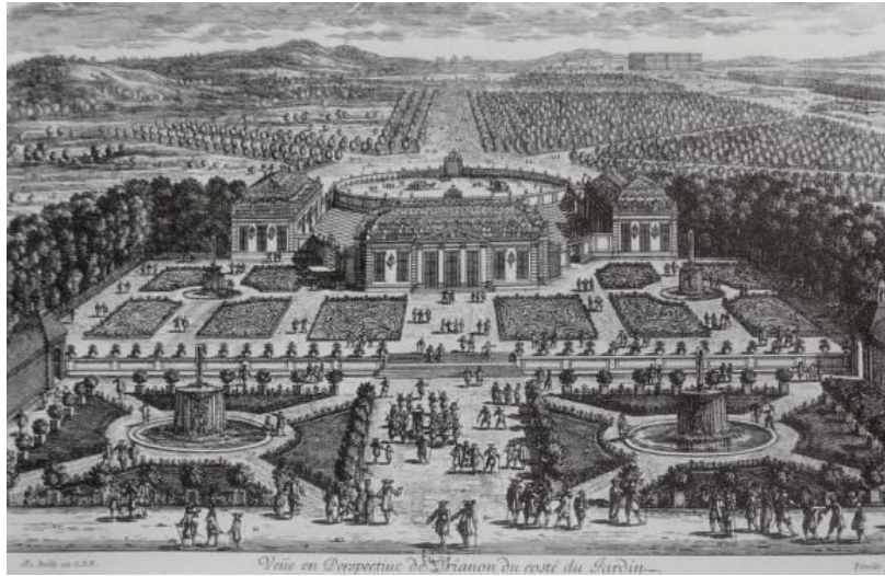
Рис. 1.2 – Версаль. Гравюра XVII ст.

У залежності від планувального характеру (стилю) садово-паркового ландшафту паркові насадження мають свій специфічний набір деревно-кущових елементів: регулярні – боскет, група, алея, рядові посадки; пейзажні – масив, або гай, група, солітер.