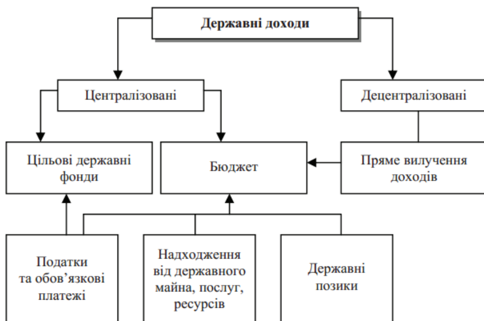
Рис. 2.2. Структура державних доходів

Структура державних доходів та їх взаємозв'язок наведена на рис. 2.2.