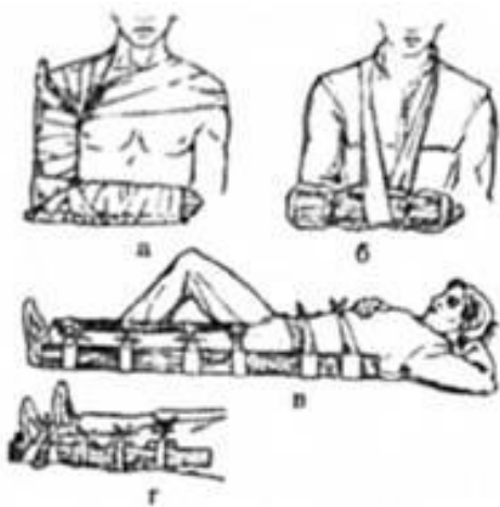
Рис. 8.10. Накладання шин при різних переломах: а - плеча; б - передпліччя; в - стегна; г - голені.