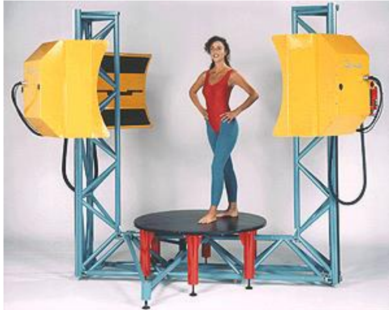
Рис. 6.1 - Автоматична установка 3D боді-сканування WB4

Завдання. Опрацювати матеріал, дати відповіді на питання.