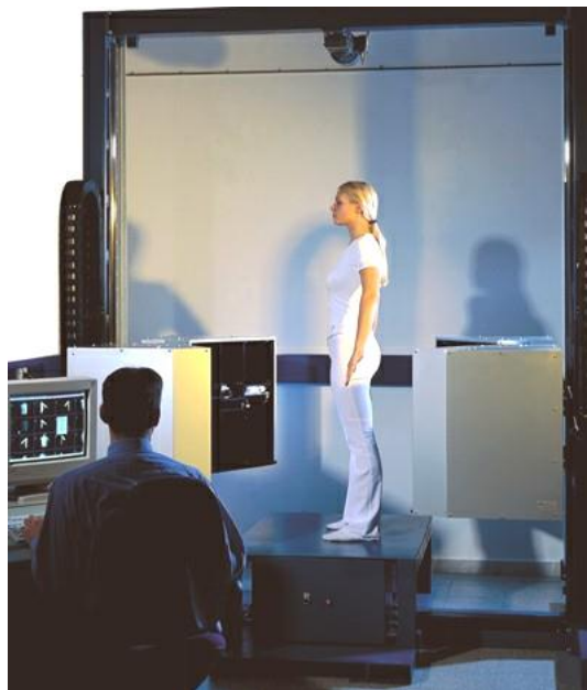
Рис. 6.2 – Приклад проведення фотозйомки цифровим фотоапаратом

Далі за провідними розмірними ознаками (зріст, обхват грудей і стегон) у системі формується тривимірний манекен, який поєднується з фотографіями в різних проекціях. Оператор поєднує антропометричні точки манекена і